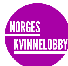
Noruega Vestíbulo de mujeres