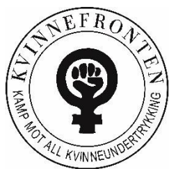
El Frente de Mujeres

Únete a nosotros, que luchamos por abolir la prostitución en todas partes y contra los proxenetes y compradores de sexo.